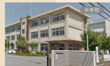
宮の原中学校 現地から約2,100m。徒歩約26分、車で約6分。