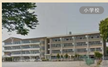
姿川第二小学校 現地から約1,500m。徒歩約19分、車で約5分。