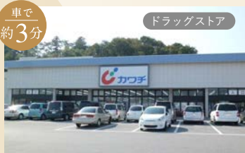
カワチ薬品 三の沢店 現地から約1,296m。徒歩約16分、車で約3分。

周辺には公園が多く2km圏内に商業施設もあり、日頃のお買い物が便利な砥上町。環状線も近いので、交通のアクセスも良好です。